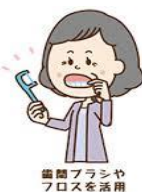
歯間ブラシやフロスを活用