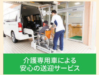
介護専用車による 安心の送迎サービス