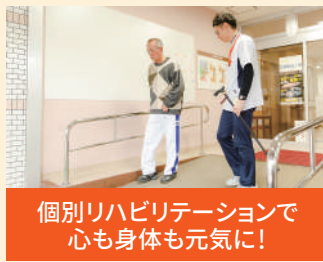
個別リハビリテーションで 心も身体も元気に！