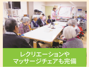
レクリエーションや マッサージチェアも完備