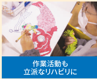
作業活動も 立派なりハビリに