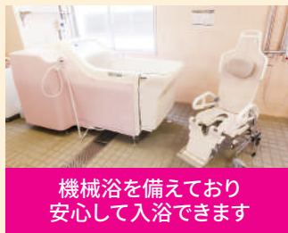
機械浴を備えており 安心して入浴できます