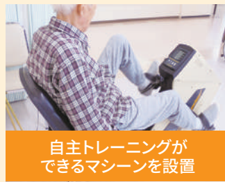
自主トレーニングが できるマシンを設置