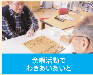
余暇活動で わきあいあいと